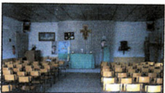
La chapelle provisoire

La volonté conjuguée de tous les partenaires peut et doit éviter l'irréparable