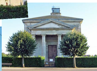
Architecture néo-classique d'inspiration gréco-romaine