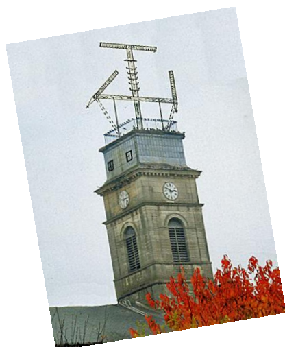
Télégraphe Chappe en 1840 Photomontage UEPA d'après croquis de Michel Ollivier